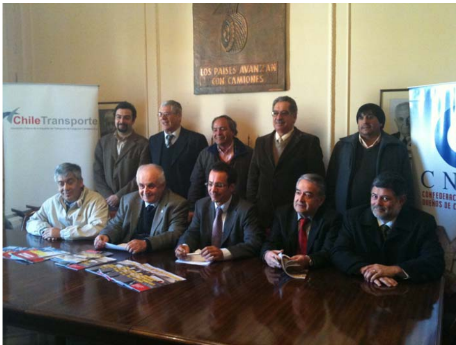
Foto N°2, Declaración en conjunto con la confederación de dueño de camiones (CNDC).